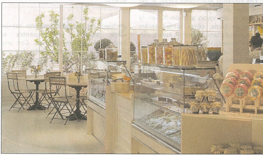
BABY DELI. En su cafetería se podrán disfrutar productos frescos con ingredientes naturales.