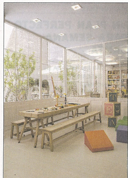
BABY DELI. Ofertan variedad de interesantes talleres para bebés y niños de hasta 8 años.

de ocio y de consumo, ofreciendo productos sanos, ecológicos, didácticos y naturales, apostando por los niños para estimular su mente e inculcarles hábitos saludables y respetuosos con el medio ambiente. Sus productos de dro-