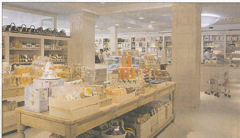
BABY DELI. En la parte de la tienda se venden productos ecológicos, artesanales y naturales.

Un largo y ancho pasillo llevará a niños y mayores a un mundo sorprendente y original. De esta manera, se presenta Baby Deli, en pleno barrio de Salamanca, como un espacio dirigi-